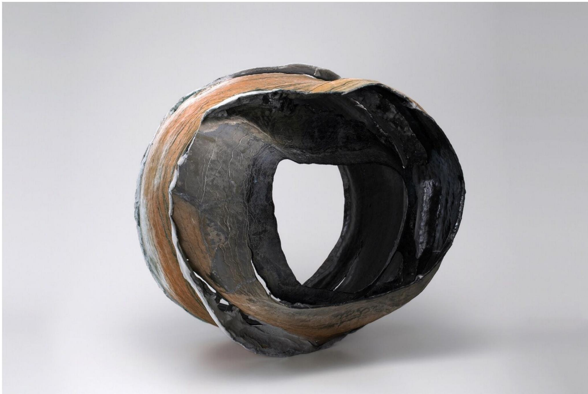
MUKURO, L48 P48 H40 (cm), 2020