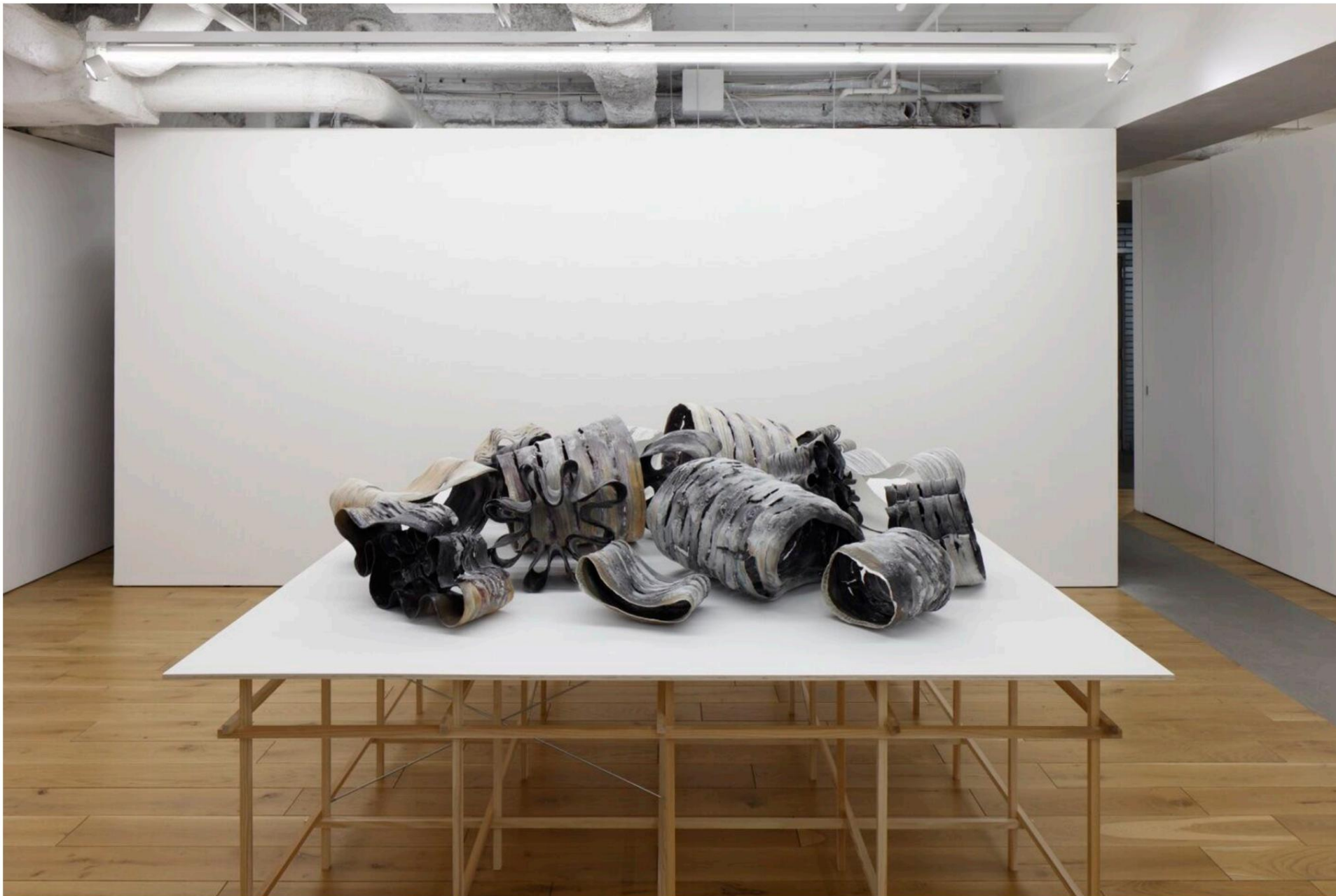
Exposition personnelle « Float » au TARO NASU, Japon, en 2023