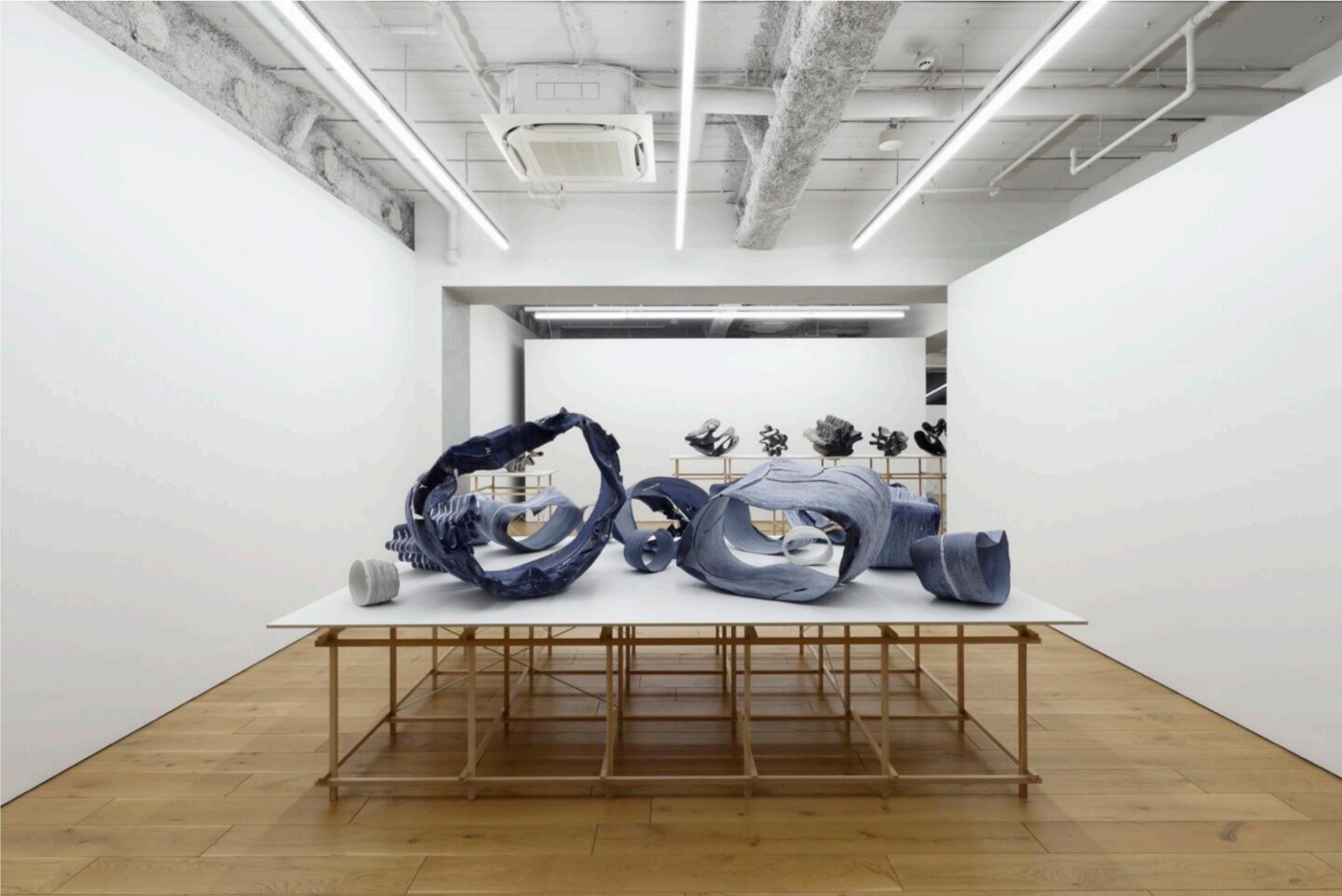
Exposition personnelle « Float » au TARO NASU, Tokyo, Japon, en 2023