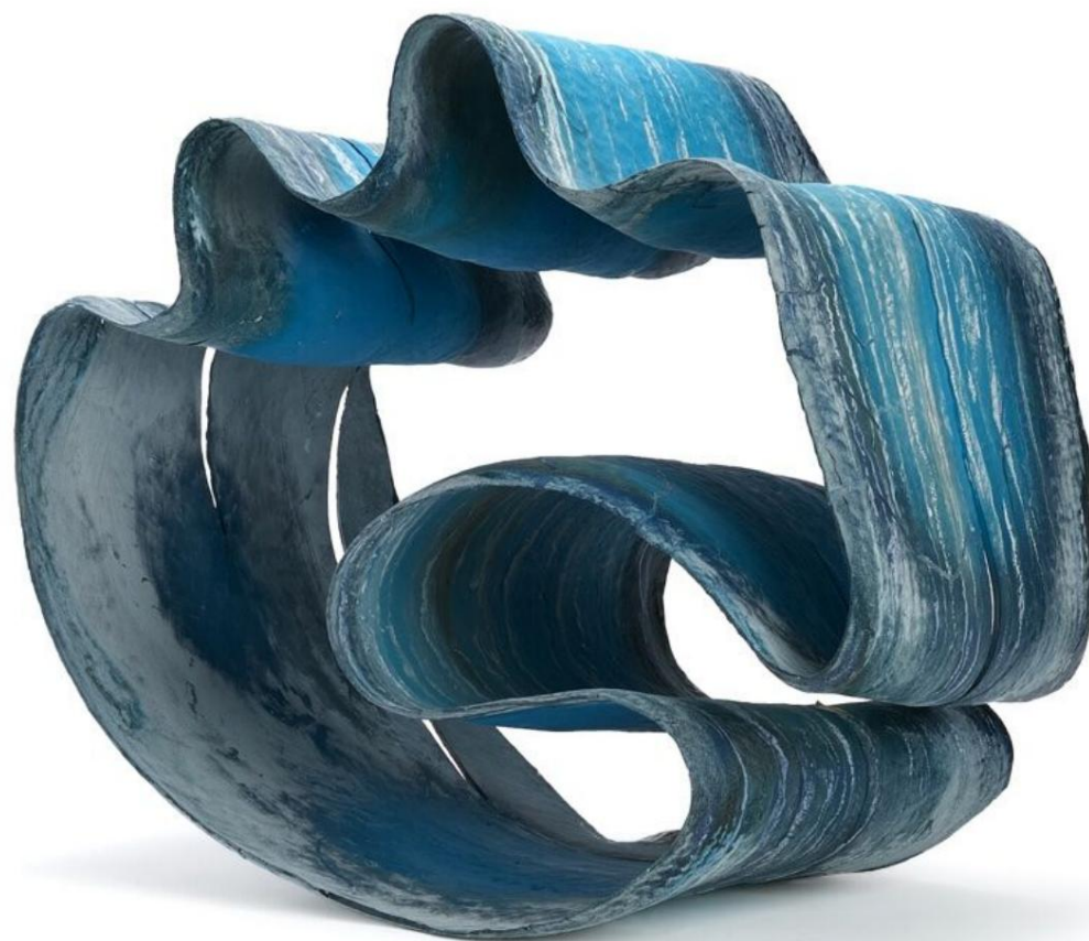
SLEET, L68 P39 H58(cm), 2023. Œuvres primées aux Ceramic Synergy Awards