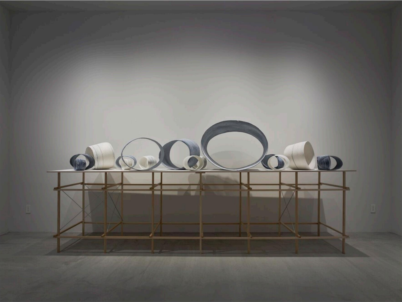
Exposition personnelle à THE BRIDGE, Osaka, Japon