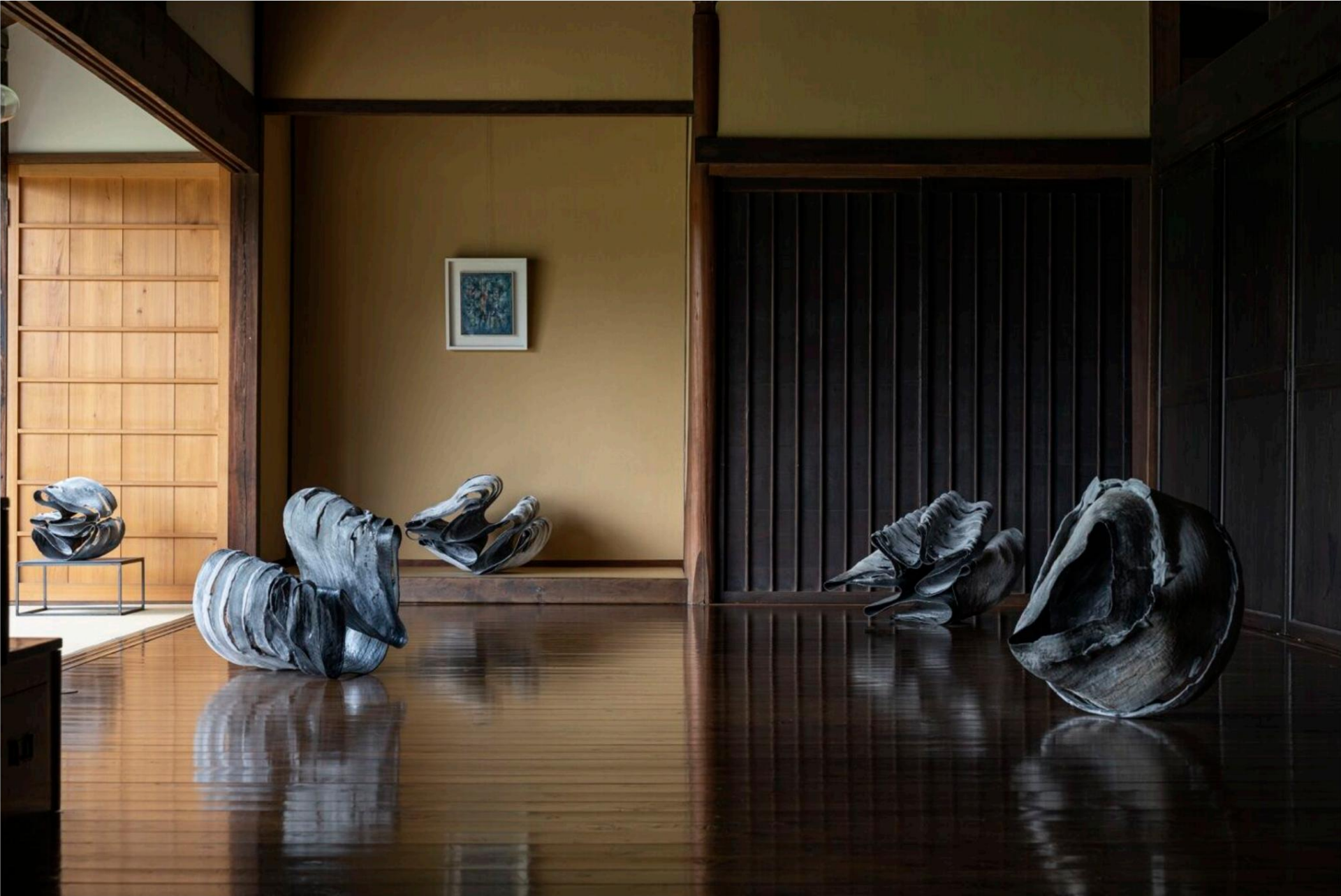
Exposition personnelle à Space Ohara, Japon, en 2021