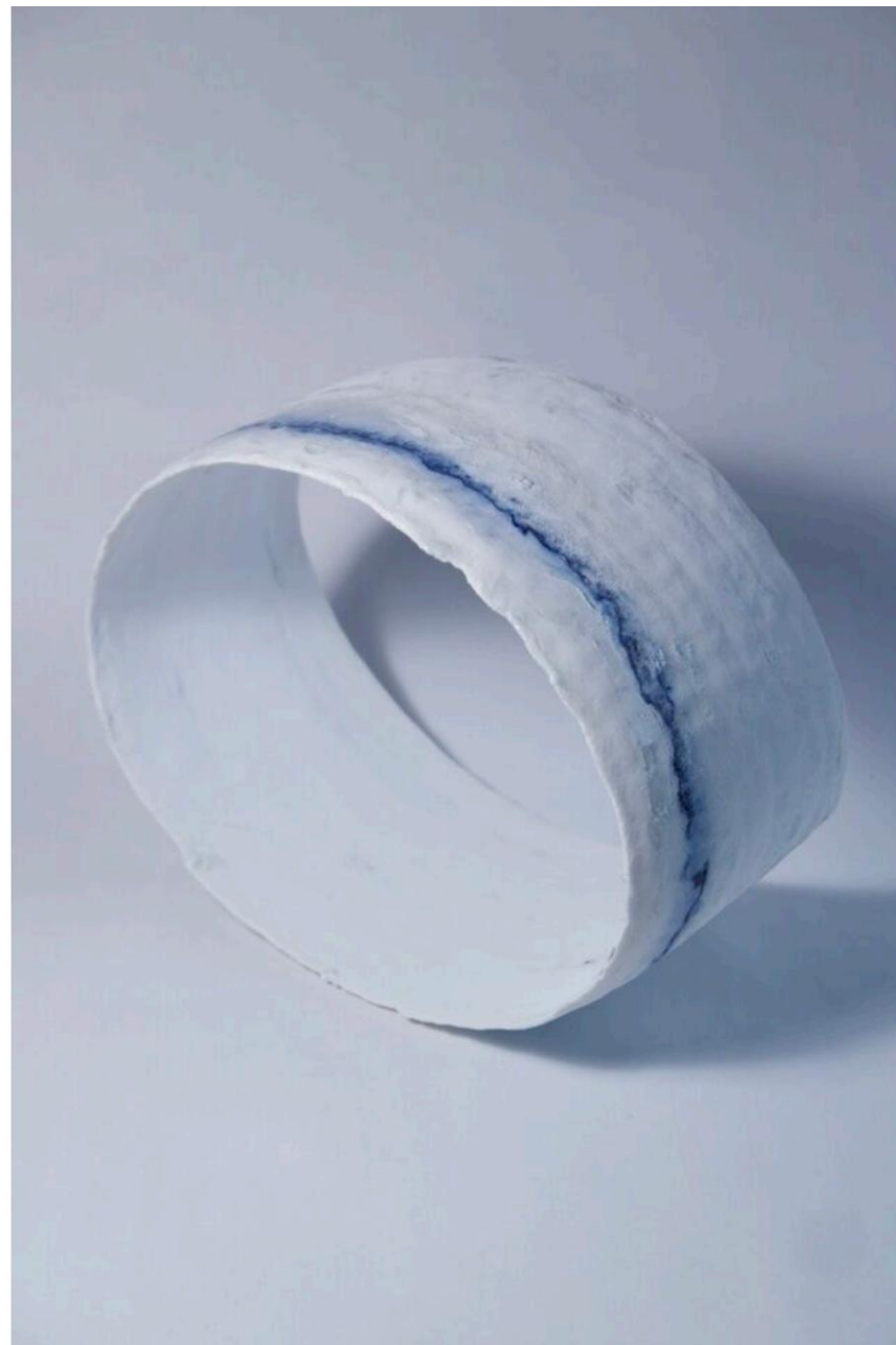
RE MUKURO, L17 P22 H11 (cm), 2024