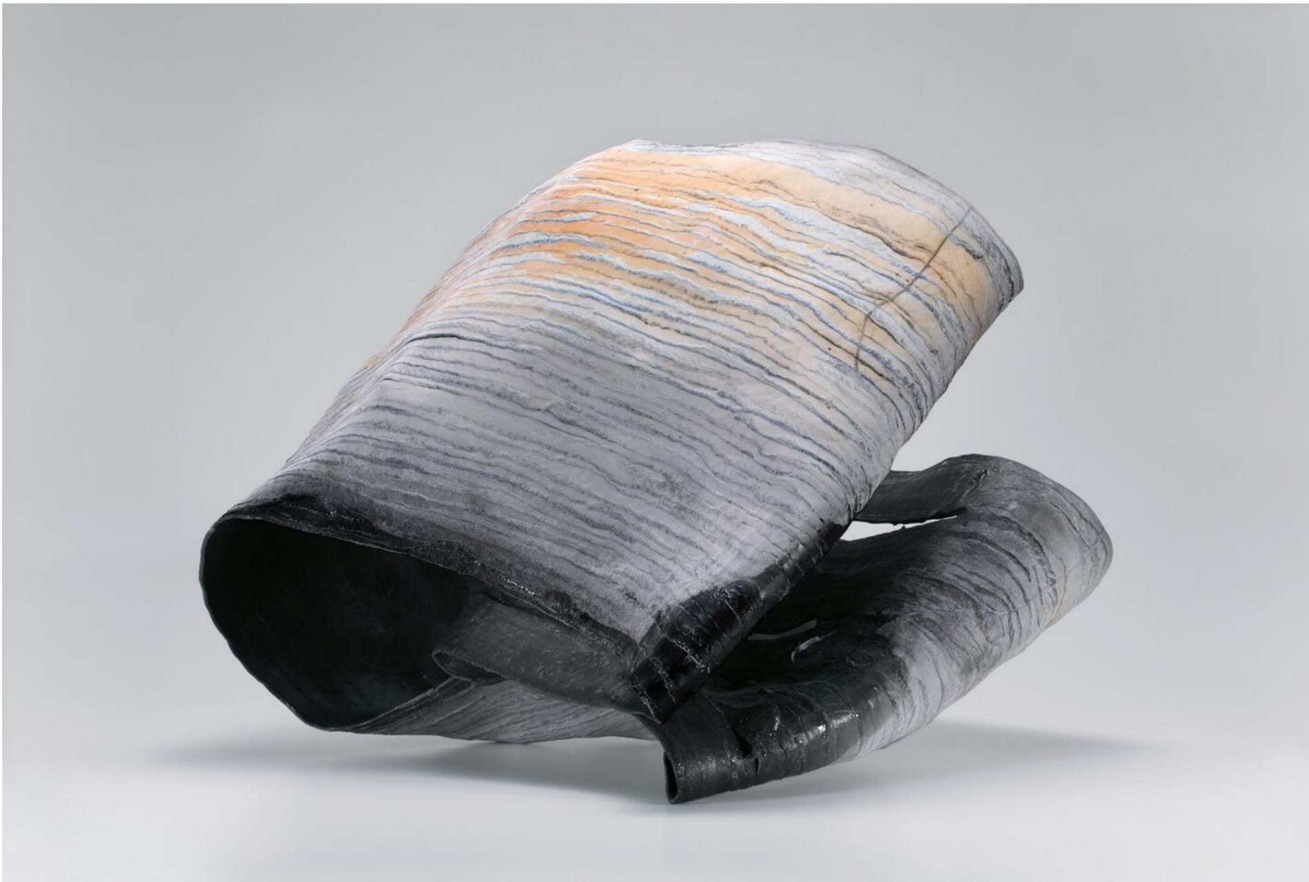
RE AYAKARU, W57 D50 H50 (cm), 2022