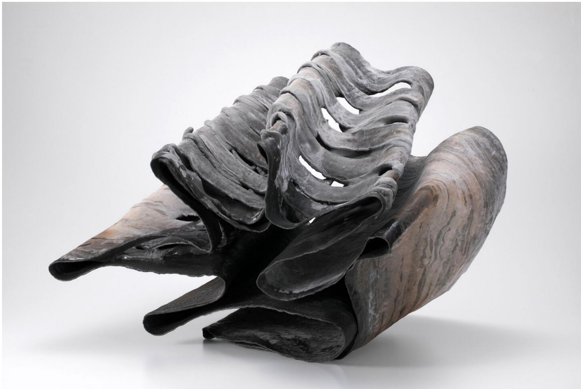
AYAKATTE, L60 P40 H52 (cm), 2021. Œuvre sélectionnée pour la 5e Triennale de Kogei à Kanazawa Artisanat