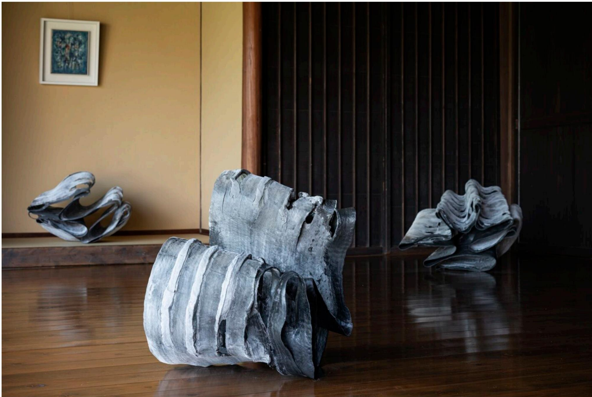
Exposition personnelle à Space Ohara, Japon, en 2021