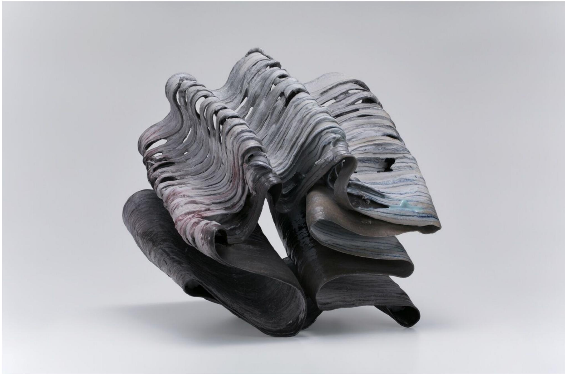
NAKARE, W51 D53 H54 (cm), 2022