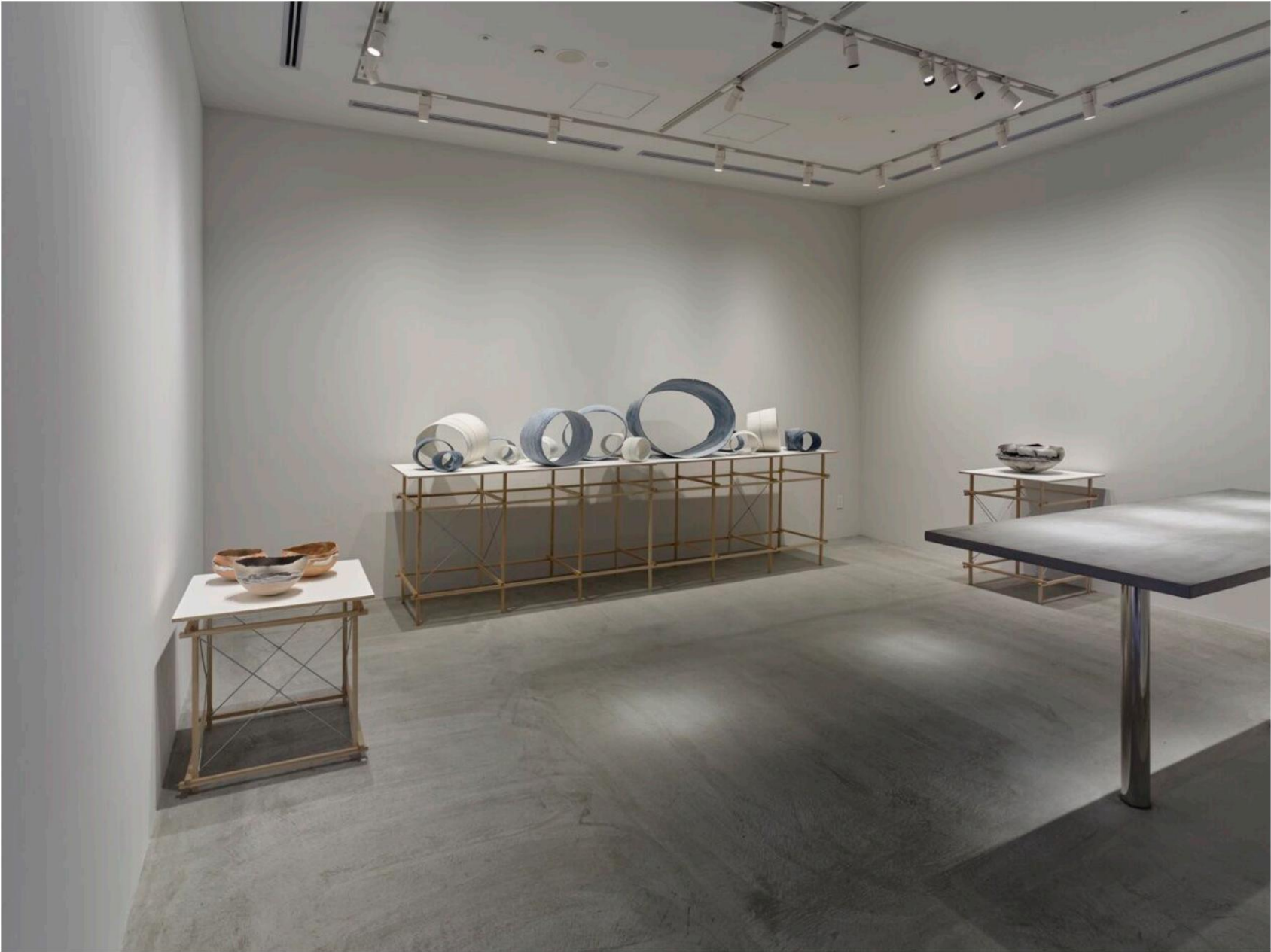
Exposition personnelle à THE BRIDGE, Osaka, Japon