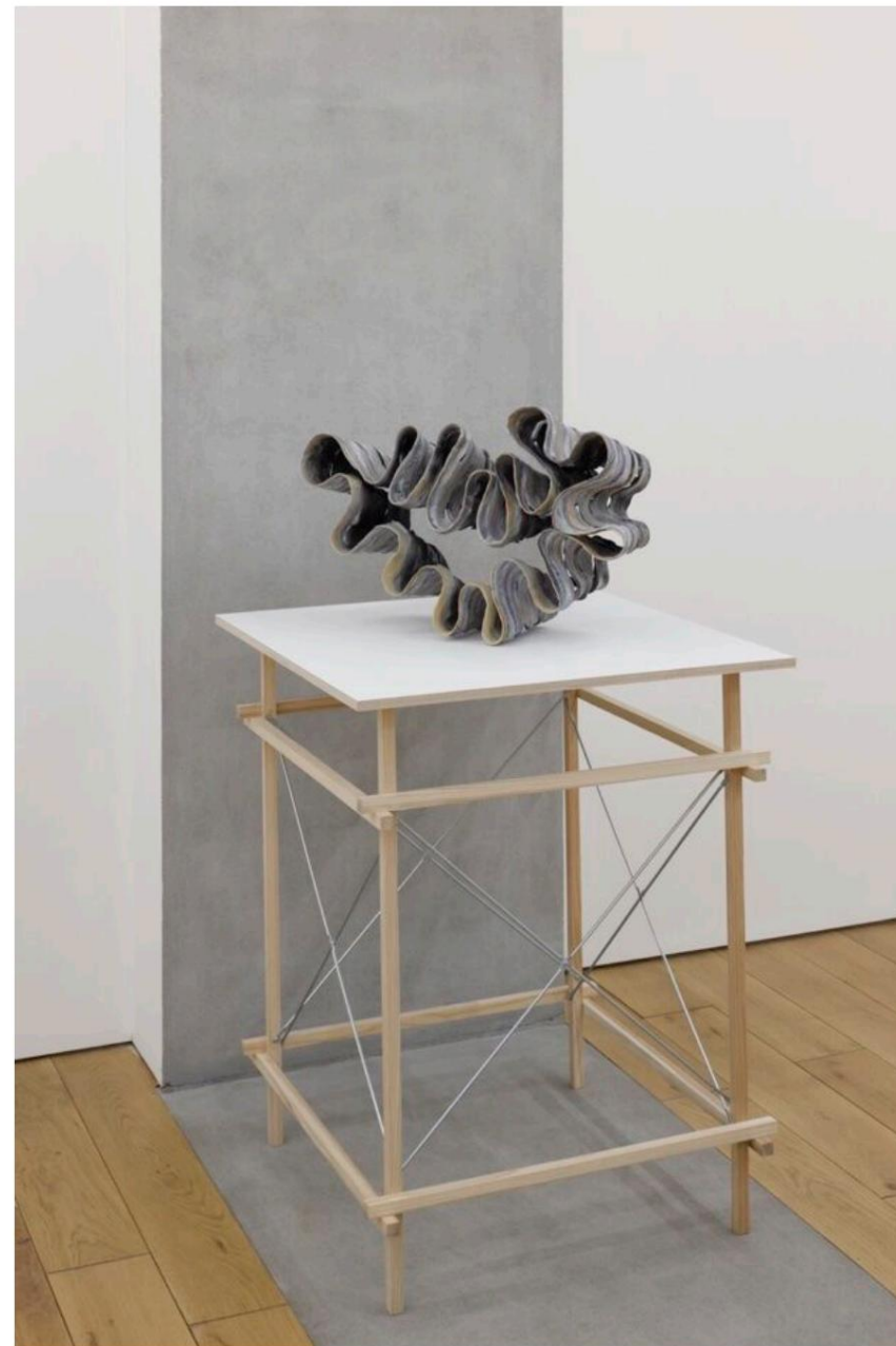
Exposition personnelle « Float » au TARO NASU, Japon, en 2023