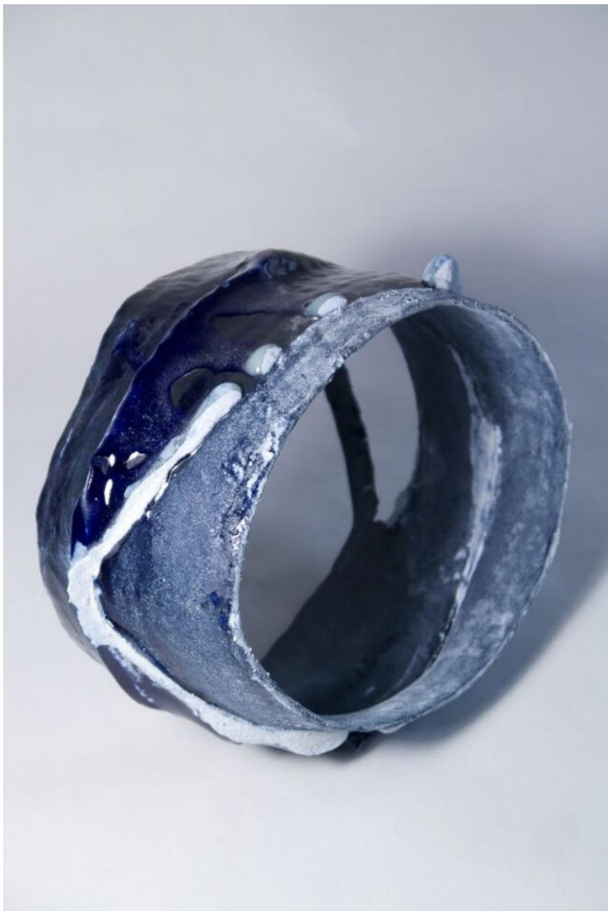
GRÊLE, L18 P22 H15 (cm), 2024